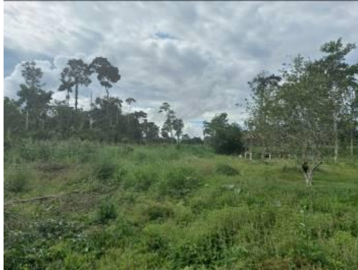
ARBOLES FRUTALES (Siekopai)