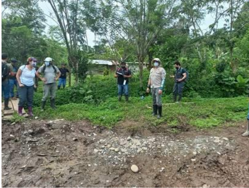
INICIO DE RECORRIDO

Director MAATE, presente en la visita al área afectada por la deforestación