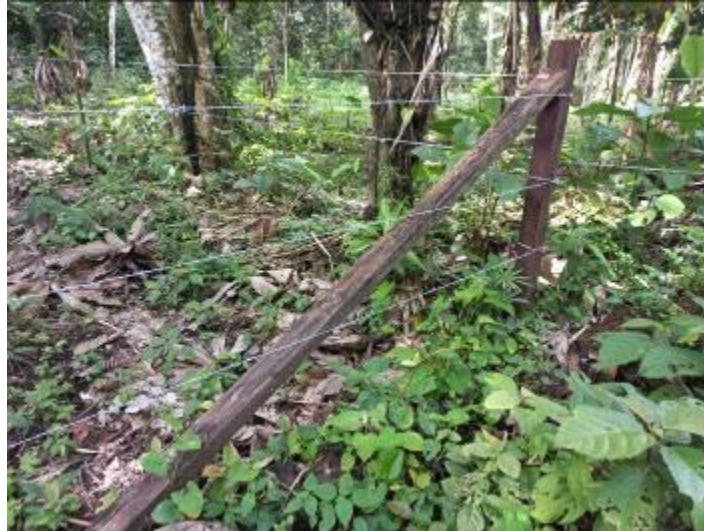
CASA VACIA (Siekopai)