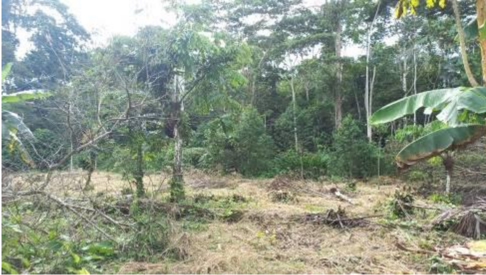
CULTIVO DE PALMA EN LOS TERRITORIOS NACIONALIDAD KICHWA